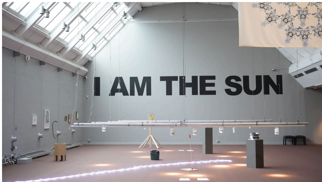
"I am the sun", Södertälje konsthall.

Det öppna och undersökande anslaget är styrkan på Södertälje konsthalls nyöppnade utställning, där vardagliga objekt framstår som symbolladdade och meningsfulla.